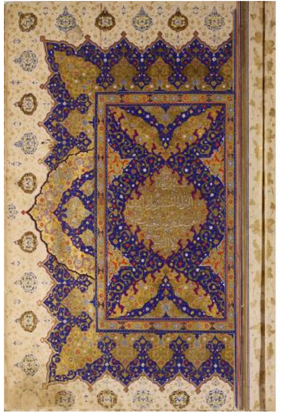
تصویر ۲: قرآن ۲۹۱ محفوظ در موزه آستان قدس رضوی

نسخه شماره ۲ در اواخر قرن دهم و اوایل قرن یازدهم هجری تهیه شده است. شرفه از بندهای اسلیمی رنگین در کنار ختایی‌های حل‌کاری مطلائی تشکیل شده؛ حاشیه‌های زیگزاگی با نقوش رو و روای زر و لاجورد مشاهده می‌شوند ختایی‌های نسبتاً ظریف و بترمه‌های طلائی مشترک میان دو زمینه رنگی هستند. زائده تزیینی منقشی با اسلیمی‌های رنگین بر حاشیه عمودی قرار گرفته. جدول زنجیره لاجورد و کادر قاب‌قابی زرین گلزار متن را محصور کرده. زنجیره لاجورد و ترلینگ‌کشی شجره در قسمت عطف صفحه قرار دارد. متن با زمینه زر و لاجورد و نقوش ختایی ظریف و بترمه‌های مطلا و اسلیمی‌های روشن و شجره تزیین شده و در قسمت مرکزی متن با زمینه طلائی و ختایی‌های بدون اتصال مشخص قرار گرفته است. متن با سفیداب نوشته شده و نشان آیات ندارد. کتیبه و سرسوره در این نسخه‌ها تعبیه نشده است.